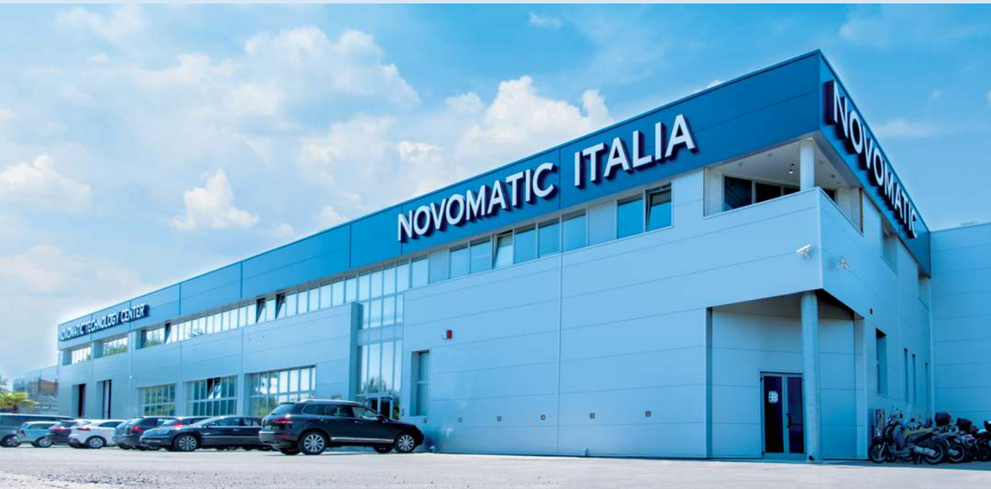
Sede operativa di Rimini - Via Galla Placidia, 2