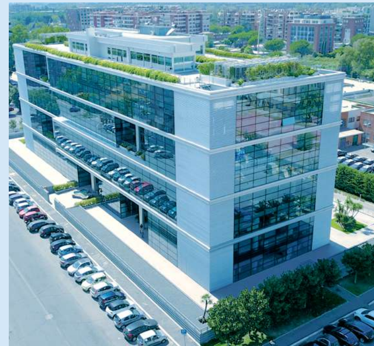
Headquarter di Roma - Via Amsterdam, 125